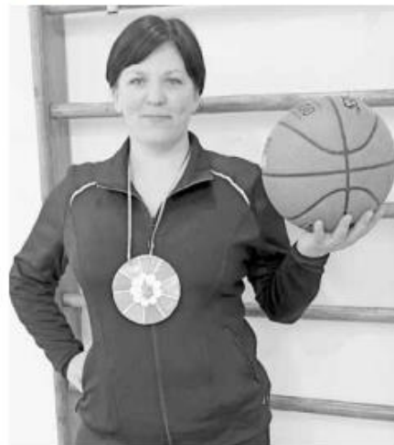
К акции присоединились томенские учителя

По случаю Всемирного дня здоровья Общероссийский Профсоюз образования провел единый день производственной гимнастики в образовательных и профсоюзных организациях «Подзарядка для всех!». К событию подключились тысячи коллективов по всей стране. Зарядка прошла и в офисе центрального аппарата профсоюза. Но за один день полезную привычку сформировать невозможно, поэтому решено провести месячник производственной гимнастики с одноименным названием.