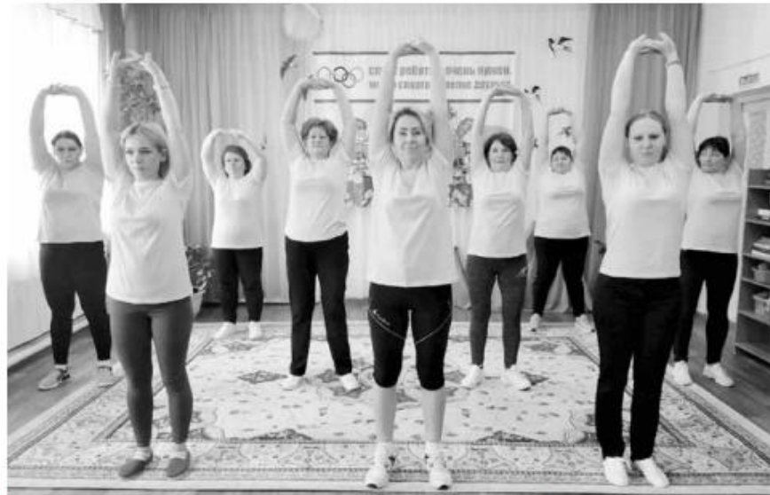
Сотрудники детского сада №41 города Ельца Липецкой области на производственной гимнастике

7 апреля в 12 часов по московскому времени сотрудники центрального аппарата профсоюза собрались в холле на производственную гимнастику. К ним присоединились члены Контрольно-ревизионной комиссии профсоюза, находившиеся на